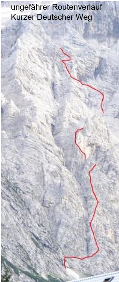
ungefährer Routenverlauf Kurzer Deutscher Weg